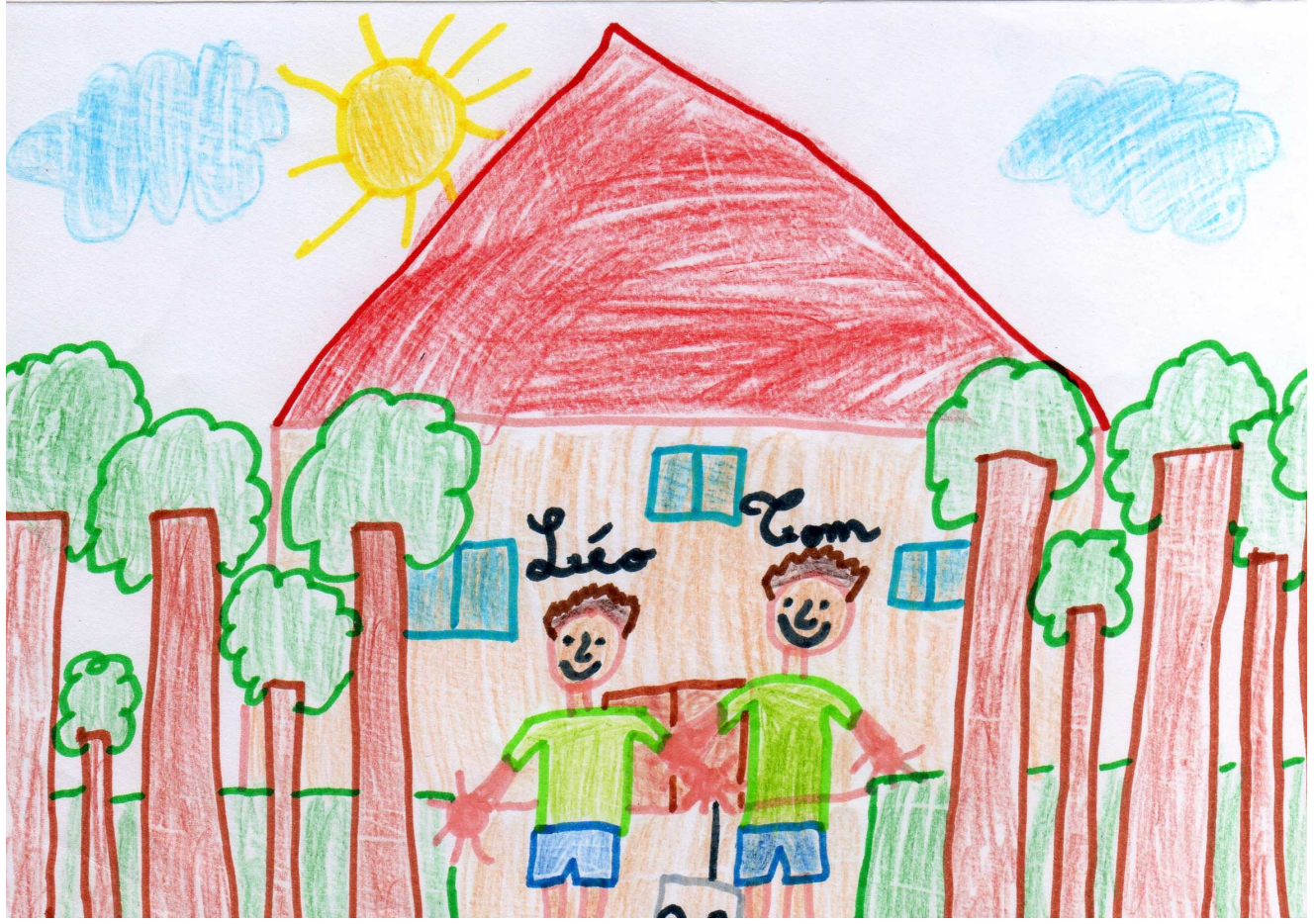
Ils vécurent ainsi longtemps tous ensemble.